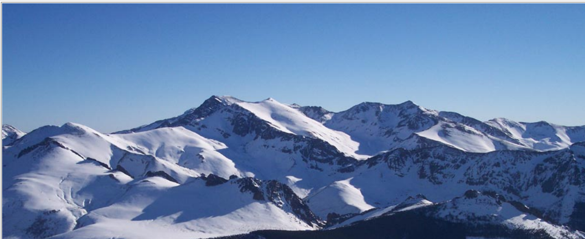
Foto facilitada por “Tres Provincias” del área de esquí de San Glorio. Todo lo que se contempla es territorio de León (Patrimonio de la Comarca de Riaño). Ahora vas a ver la misma foto con indicaciones de las zonas de esquí.

Dejemos claro, una vez más, que la estación de esquí se haga como se haga estará en León. Sin la aportación de los valles de León no hay posibilidad de estación de esquí. ¿Por qué permitir accesos desde otras provincias? Los motivos son sólo económicos y sólo para beneficiar a los Promotores “Tres Provincias” y a las poblaciones de las provincias de Palencia y más adelante, Cantabria. Desgraciadamente no solo no benefician adecuadamente a León sino que perderemos –para siempre- las mejores áreas de esquí de 700 km alrededor y no habremos conseguido nuevas infraestructuras ni mejorar las condiciones de vida de la Comarca da Riaño.